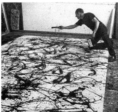
Pollock en plena inspiración