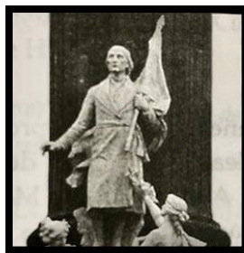
Imagen 9. ENRIQUE ALCIATI, Estatua de Miguel Hidalgo, a cuyos pies aparecen las alegorías femeninas de la Gloria y la Historia , en la columna de la Independencia, 1910, mármol, paseo de la Reforma, México D.F.

El escultor italiano Enrique Alciati nos ha legado la imagen porfiriana de Miguel de Hidalgo como "Divino anciano" (O' Gorman, 1964: 237), la que se ve esculpida en blanco mármol de las canteras italianas de Carrara, presidiendo la Columna de la Independencia (1902 — 1910), emplazada en el Paseo de la Reforma de la Ciudad de México (Noelle, 2006: 233 - 234). Miguel Hidalgo, representado con la vestimenta de la época, se muestra en actitud vigilante con el estandarte de la venerada imagen de la Virgen de Guadalupe en la mano derecha; mientras que una figura femenina que representa a la Historia, de talante reposado y noble, registra en un libro las hazañas de los héroes, y la alegoría de la Patria le ofrece una corona de laurel que él rehúsa (Gutiérrez, 2004: 549 y Zárate, 2003: 438) (Img. 9). La magnífica pieza de 4, 20 metros de altura, logra transmitir la idea de un Hidalgo tranquilo y a la vez decidido. Vale la pena resaltar, siguiendo al historiador francés Maurice Agulhon (1994: 247), que, a través de este tipo de simbología cívica, se construye una doble relación en el imaginario colectivo, entre la figura del héroe —Padre de la Patria— y los valores primigenios de la nación, y entre los ciudadanos y los valores representados por la figura conmemorada 16 .