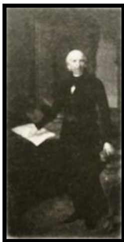
Imagen 8. JOAQUÍN RAMÍREZ, Retrato del Benemérito de la Patria General Miguel Hidalgo y Costilla , 1865, óleo sobre tela, 240x156cm, Galería de Insurgentes, Palacio Nacional, México D.F.

Una iconografía muy diversa procedió a aquella que se va haciendo prolífica, la que devendría en oficial, la que el pintor Joaquín Ramírez (1832 -1866) realizó en el año 1865, a petición del director de la Academia de San Carlos, Santiago Rebull Gordillo (1829 - 1902), durante el efímero imperio de Maximiliano de Habsburgo (1863 - 1867). El pintor académico lo plasma entonces de cuerpo entero y nos presenta un retrato de un hombre con fuerza, serio, veterano, con la experiencia de los años, aunque en realidad el cura de Dolores que dio el grito de Independencia — ¡Viva Nuestra Señora de Guadalupe y mueran los gachupines! — era, en realidad, un hombre en plena madurez con 57 años de edad (Img. 8).