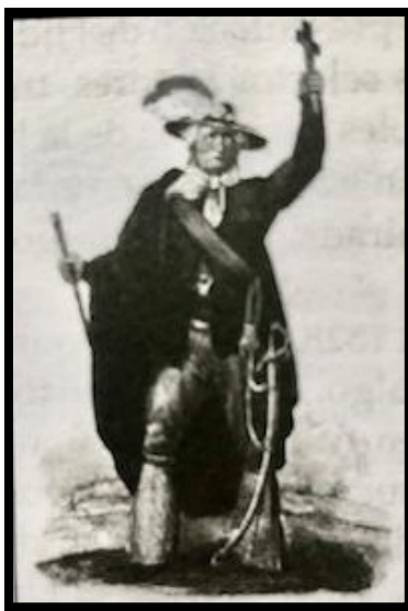
Imagen. 3. CLAUDIO LINATI DE PRÉVOST, Hidalgo , 1828, en: Trajes civiles, militares y religiosos de México, litografía, 21,5x15cm.

grupo más reducido de soldados y lo que se antoja humareda de cañones. Al pie de la imagen, hay un texto en francés que, traducido al español, reza: " Hidalgo. Cura de Dolores. En su traje de guerra, proclamando la independencia de México. (Fusilado el 1º de agosto de 1811). Conforme al cuadro original ". La fecha está errada porque el fusilamiento del cura de Dolores ocurrió en la mañana del 30 de julio, y se desconoce cuál es el " cuadro original " al que se refiere (Img. 3). La solución compositiva adoptada por Linati es bastante habitual en este tipo de retratos históricos, con el personaje posando sobre un horizonte muy bajo, lo que contribuye a realzar su papel protagonista. Pese a lo altamente teatral de la pose, los ribetes fantásticos de la indumentaria y los caracteres del padre Hidalgo, es muy posible que la interpretación plástica de Linati sea más convincente de lo que a primera vista se antoja, como ya el recordado historiador mexicano Edmundo O' Gorman (1964: 232) lo señalara hace tiempo.