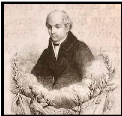
Imagen 7. El venerable D. Miguel Hidalgo y Costilla , en: La Ilustración Mexicana, litografía de Decaen