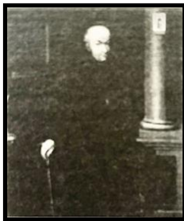
Imagen 5. ANTONIO SERRANO, Retrato del cura D. Miguel Hidalgo y Costilla , 1831, óleo sobre tela, 124x110cm, Museo Nacional de Historia, México, D.F.

sotana y la derecha apoyada en un bastón. Su actitud parece indicar que se halla a punto de salir de su estudio o, acaso, que acaba de regresar a su vivienda. Al fondo, una mesa, una estantería bien surtida de libros magníficamente empastados, pluma y tintero y una minúscula estampa de la Virgen María de Guadalupe, clavada sobre el fuste de una maciza columna (Img. 5). Sobre esta obra, Ramírez (2003: 197) señala que se trata del primer retrato al óleo con carácter histórico que representa al cura párroco de Dolores. Esta representación, de sobrio colorido, se encuentra más en relación con el hombre, con el sacerdote, y está lejos del protagonismo histórico, con lo que, probablemente, se evitaba cualquier referencia al papel de Miguel Hidalgo como jefe del ejército insurgente; más problemática, a la vez que se destacaba su lugar como ideólogo de la independencia (Quirarte, 2007: 289).