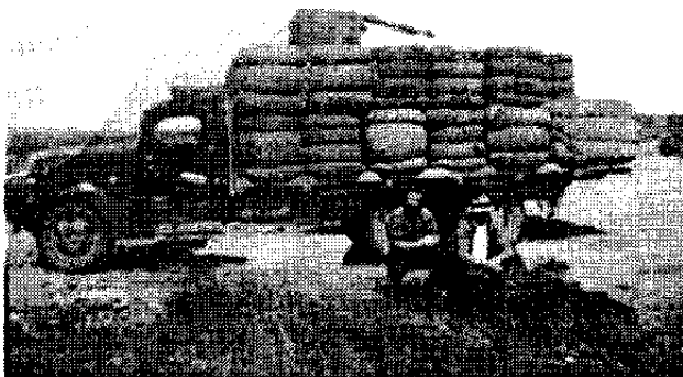
Transporte de lana desde el campo, circa 1948

Se desarrolló el mercado con el interior, porque Río Mayo, Buen Pasto, Aldea Beleiro, Ricardo Rojas y Río Senguer entre otros, necesitaban de una salida de sus productos, el paso intermedio para la conexión con el puerto era el ferrocarril en Colonia Sarmiento. En este contexto la Colonia generó la industria hotelera y contribuyó al crecimiento de la actividad comercial, financiera y de transporte.