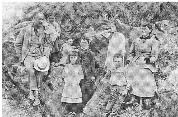
Familia típica de la Colonia, circa 1920

Las diversas formas de adjudicaciones de la tierra distinguían a grandes, medianos y pequeños propietarios; y arrendatarios, u ocupación a título precario. El desarrollo de la actividad comercial también diferenciaba a grandes, medianos y pequeños comerciantes, hasta vendedores ambulantes de cueros, pieles y lanas. En esta diferenciación social se integran empleados, jornaleros y peones.