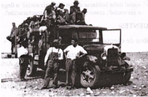
Cuadrilla de esquiladores, circa 1930

La esquila constituye una de las tareas más importantes, ya que de ella depende la zafra lanera. Se realizaba por una cuadrilla de esquiladores en unos pocos días. Esta actividad necesita ocupar mano de obra temporaria para desarrollar diversos oficios tales como: el agarrador, el atador, el afilador, el latero, el cocinero para la cuadrilla y el esquilador.